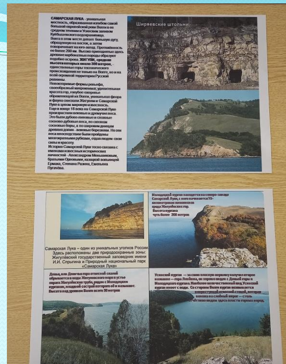
Листовка «Самарская Лука»