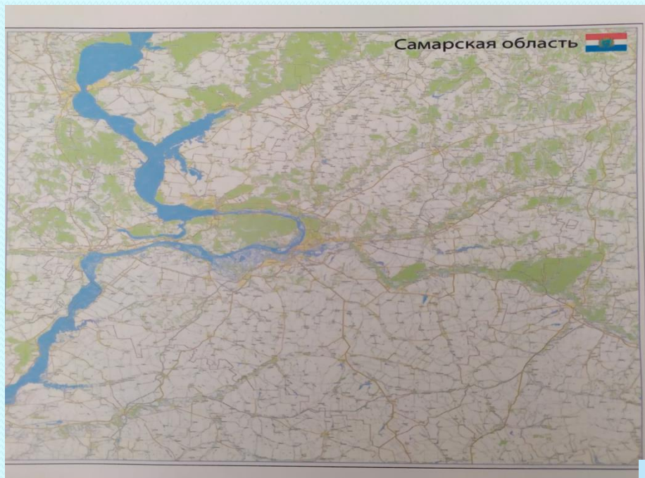
карта Самарской области