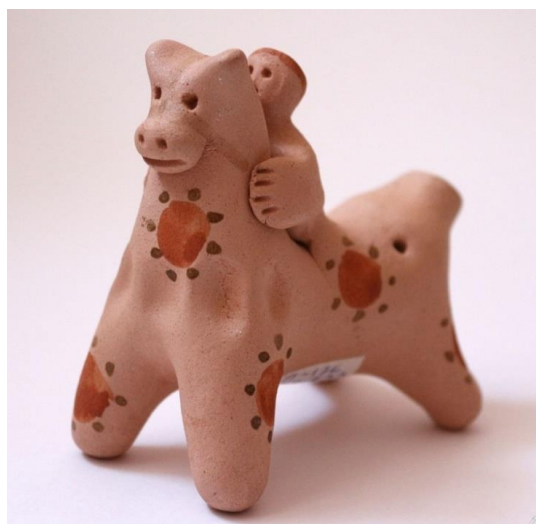
Плешковская русская народная игрушка

Также широко была распространена тема крестьянского быта. Например, очень популярный образ для глиняной фигурки — женщина с младенцем на левой руке. Среди скота чаще всего изображали коров, петухов, баранов, лошадей.