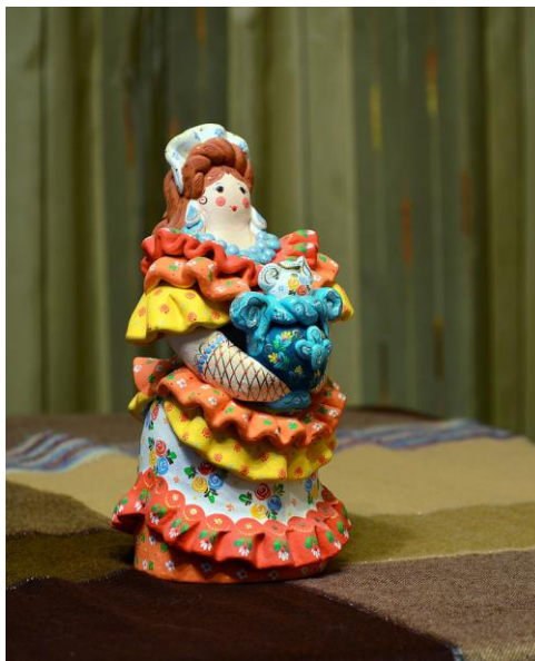
Дымковская народная игрушка «Девушка с самоваром»

и семьями. К началу XIX века игрушки из Дымкова распространились по всей России.