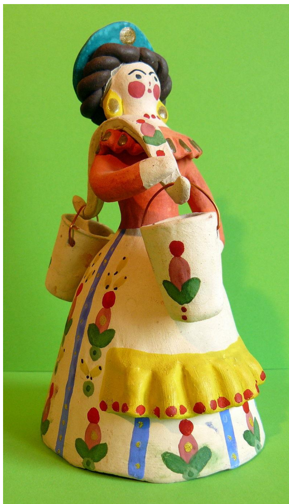
Дымковская русская народная игрушка «Водоноска»

животных. Русские традиционные игрушки выполняются в основном из глины, дерева, соломы и бересты.