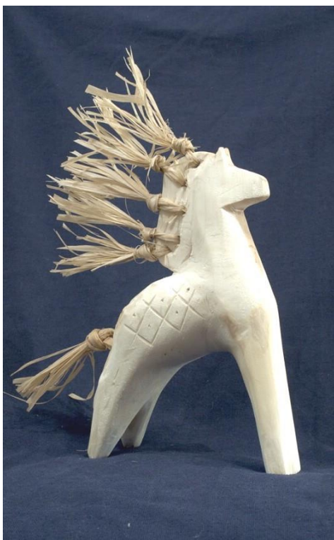
Мазыкская русская народная игрушка «Коник»

Основная особенность производства игрушки — использование только топора, другие инструменты применяются крайне редко. Игрушка выполняется из сосны, осины или липы. Традиционно изготавливают ее и из полешка с торчащими сучками. Эти сучки используют в изделии, они могут превратиться в хвост или клюв, а могут стать плавниками у щуки.