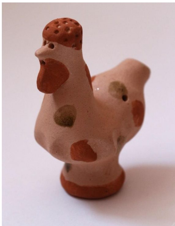
Плешковская русская народная игрушка

Также широко была распространена тема крестьянского быта. Например, очень популярный образ для глиняной фигурки — женщина с младенцем на левой руке. Среди скота чаще всего изображали коров, петухов, баранов, лошадей.