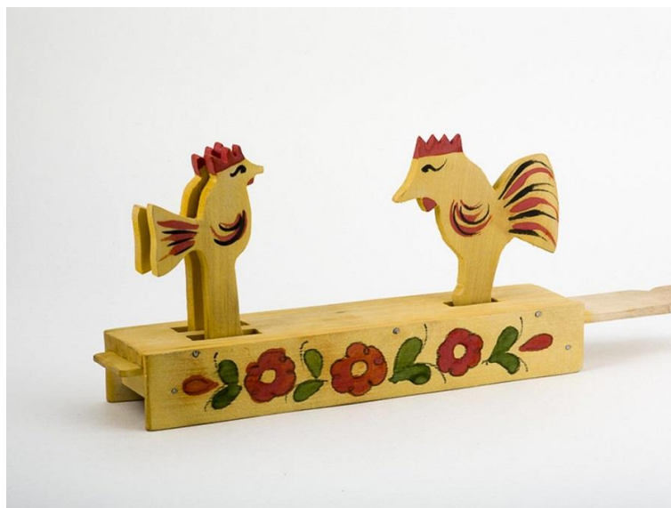
Федосеевская русская народная игрушка

Игрушки мастерят с помощью ножа и топора, используя деревянные щепки и дощечки. Щепки и дощечки сколачиваются гвоздиками и расписываются незамысловатыми узорами. Изначально игрушки расписывали гусиным пером. Позднее стали окунать изделие целиком в желтую краску, получая солнечный фон, а затем наносили цветы.