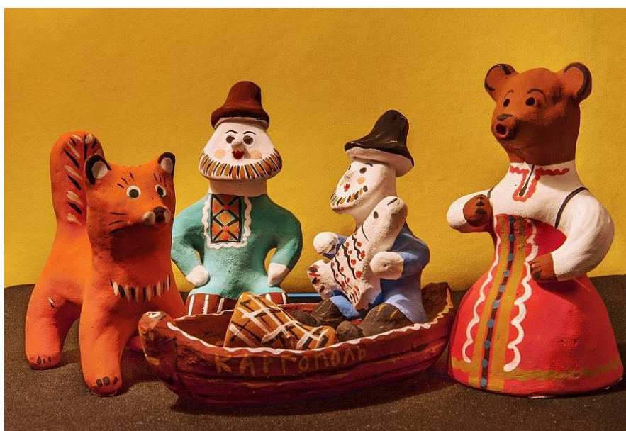
Каргопольская русская народная игрушка

Русская народная игрушка является важным этническим элементом и памятником традиционной культуры русского народа. Она представляет собой синтетический вид народного творчества, в котором соединяются средства декоративно-прикладного и изобразительного искусства, музыкальные элементы. Игрушка — это также традиционный элемент воспитания детей. Дети познают мир и социализируются в обществе через игру. Традиционные народные игрушки различаются по типу, материалу и способу изготовления. Кроме того, существует взаимосвязь народной игрушки с разными видами хозяйственной деятельности людей, орудиями труда и религиозными верованиями. Народная игрушка являлась важным элементом социализации и воспитания детей.