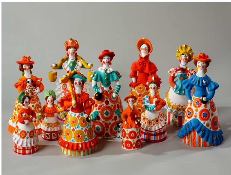
Дымковская русская народная игрушка

Для изготовления дымковской игрушки используется вятская красная глина и речной песок. Каждая деталь игрушки создается отдельно: из круглого куса глины лепится тело, на которое прикрепляются остальные части игрушки. Далее изделие несколько суток сушится на открытом воздухе. Затем обжигается на огне. На Руси для этого использовали печь. Сегодня это муфельная печь, где температура достигает 1000 °С. Когда фигурка остывает, ее подвергают отбеливанию. На Руси для этого использовали в том числе и молоко.