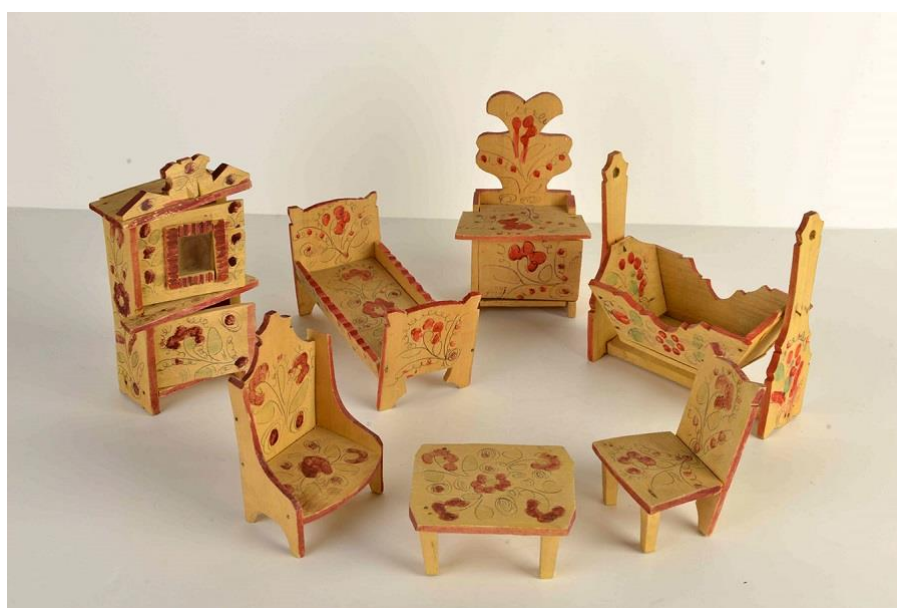
Федосеевская русская народная игрушка

Основной сюжет федосеевской игрушки — кони. Также вырезали кукольную мебель, автомобили, лодки, карусели, санки, самолеты, трамваи, многоэтажные пароходы. К 1930-м годам федосеевские игрушки стали выпускать на промышленной основе в городе Семенове. В 1948 году федосеевскую артель игрушечников присоединили к Семеновскому кооперативу.