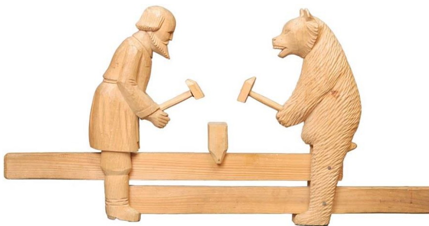
Богородская русская народная игрушка

Богородская русская традиционная игрушка происходит из села Богородское Московской губернии. Игрушка выполняется из дерева, в основном из липы. Перед изготовлением игрушки липа должна сохнуть два года. Щепки от дерева используют для производства подставок для игрушек. Богородские игрушки редко разукрашивают или расписывают. Поверхность готовых фигурок на Руси зачищали наждачной бумагой. Далее игрушки отделяются резьбой, которая ритмично ложится на поверхность и украшает изделие. По традиции некоторые части игрушки делали подвижными. Одни игрушки крепились на подставках-тумбочках, а внутрь вставлялась пружина — она и приводила фигурку в действие.