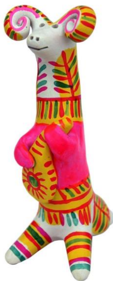
Филимоновская русская народная игрушка «Баран»

В целом филимоновская игрушка отличается от других вытянутой формой и удлинёнными пропорциями. Это продиктовано особенностями местности, так как в Тульской области богатые залежи жирной глины, она хорошо подходит для придания формы, однако при сушке значительно оседает и трескается. Мастера неоднократно выправляют фигуру, вытягивают ее, чтобы тем самым скрыть неровные контуры и трещины.