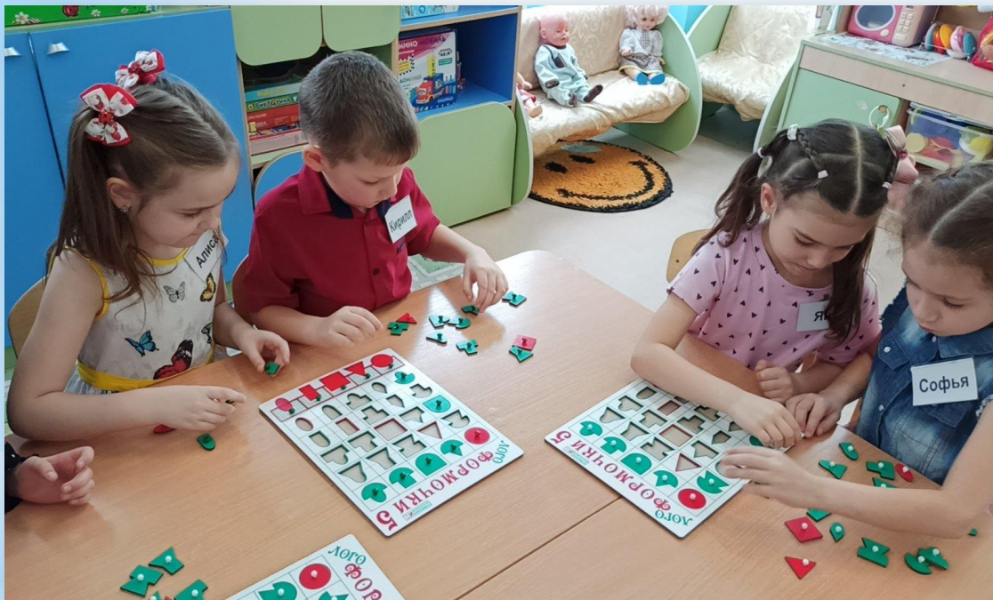
Ряд «корешки» справа от круга